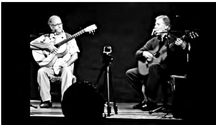
Contrapunto realizado el 15 de febrero de 2014 en La Sebastiana, casa de Pablo Neruda en Valparaíso.

https://www.youtube.com/watch?v=bfSyexHEpic