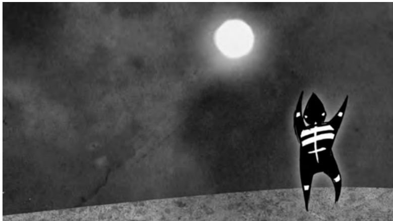
Fotograma del cortometraje Selknam: La creación del mundo

Luego de observar el cortometraje, responde las preguntas. Si lo necesitas, puedes volver a verlo.